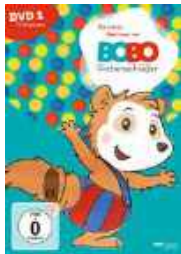
Bobo Siebenschläfer DVD 1